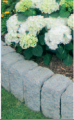
HANG- UND RANDBEFES- TIGUNGEN